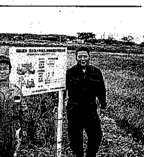
農家の耕作放棄地。田舎の風景が写っている。

「耕作放棄地の増加は、農家が逃げたせいではな...」という声。地域から問う。耕作放棄地の増加は、農家が逃げたせいではな...という声。